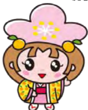
千曲市キャラクター『あん姫』

主催: 清泉女学院大学・短期大学 共催: NPO ホットライン信州 協力: 千曲市 花さかフェスタ実行委員会 信州千曲ブランド認定業者の会 JA ながの JA 中野市 NPO フードバンク信州 ほか