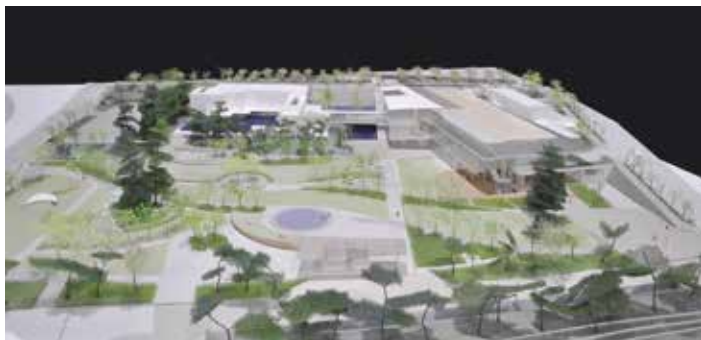
新・信濃美術館 イメージ模型およびパース図

7月6日(土) 14時から16時まで: 信濃美術館学芸員のかたをお迎えして、 長野における美術館と大学連携の可能性等を考えるトークイベントを実施。 現在建て替え中の新・信濃美術館の今後の展望等についても考えます。 フロアの方も気軽に参加できる座談会形式です。入場無料、入退場自由。