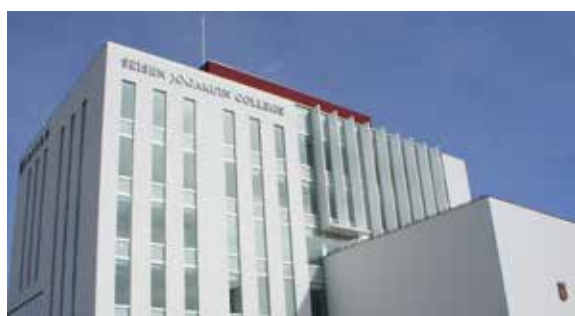
清泉女学院大学 長野駅東口キャンパス (看護学部)

清泉女学院大学 長野駅東口キャンパス 1階ピラールテラスにて 長野市栗田1038-7 (JR長野駅東口から徒歩すぐ)