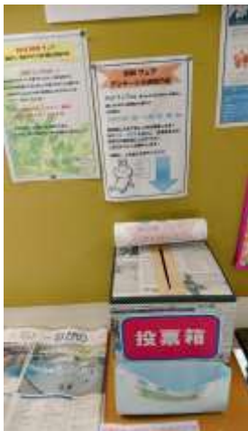
昇降口の箱はこちら